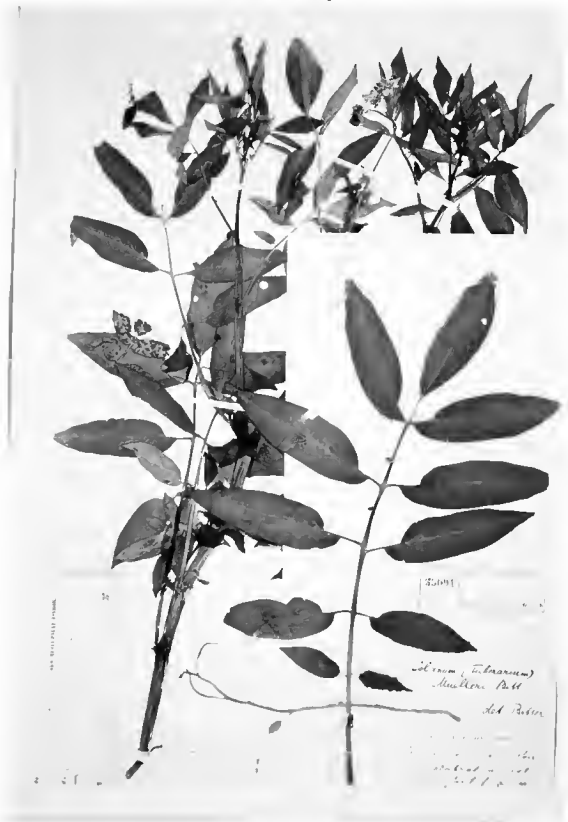
Figura 2 - Amostra número 302.940 do herbário do Jardim Botânico, Rio de Janeiro-RJ. Trata-se de fotografia do Tipo, depositado no Herbário W, em Viena, Áustria. A maioria das amostras coletadas por Fritz Müller e depositadas em herbários europeus ainda não foi inventariada. Felizmente a facilidade atual de se obter fotografias permite enriquecer os herbários brasileiros com essas “duplicatas”, de valor museológico e útil a estudos taxonômicos. A etiqueta do Jardim Botânico não está visível e contém manuscritas as informações de praxe (número da amostra, identificação taxonômica, local, data, coletor), difíceis de serem lidas na fotografia.

No Jardim Botânico existem apenas 6 amostras coletadas por Fritz Müller e fotografias de 2 espécimes (Figura 2) que estão em museu europeu. As informações registradas na Tabela 2 foram obtidas diretamente das exsicatas. Não se conhece a data de coleta de nenhuma amostra. As fotos documentam os tipos de duas espécies selvagens de batatas, identificadas por Friedrich August Georg Bitter ( Solanum muelleri foi batizada por Bitter em homenagem a Fritz Müller) e depositadas no herbário W, do Museu de História Natural de Viena, na Áustria.